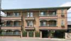
カジノ (ファミリー向け 2LDK)