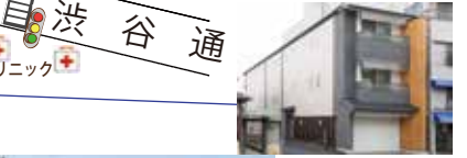
アルヴァーレ (ファミリー向け 2LDK)