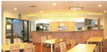
レストラン トラットリア シレーネ