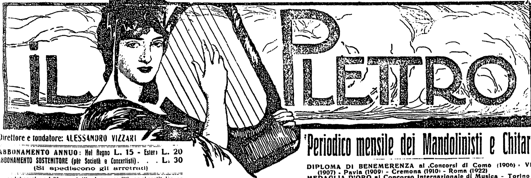
(Conto corrente colla Posta)