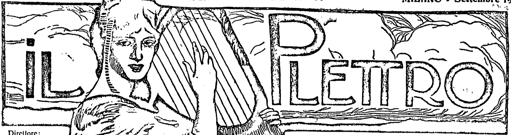
(Canto corrente colla Posta)