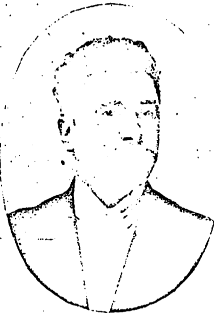
Figure di musicisti che onorano l'arte

Il Maestro MEZZACAPO di Napoli Direttore della rinomata Estudiantina Lombarda di Parigi, fondata nel 1895.