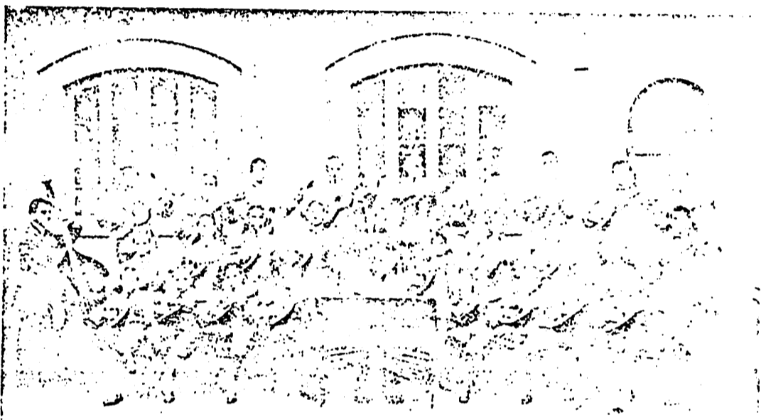
Orchestra mandolinistica del Pio Istituto per i Figli della Provvidenza di Milano

Spedire vaglia all'Amministrazione del Pletto - Casella Postale 542 - Milano.