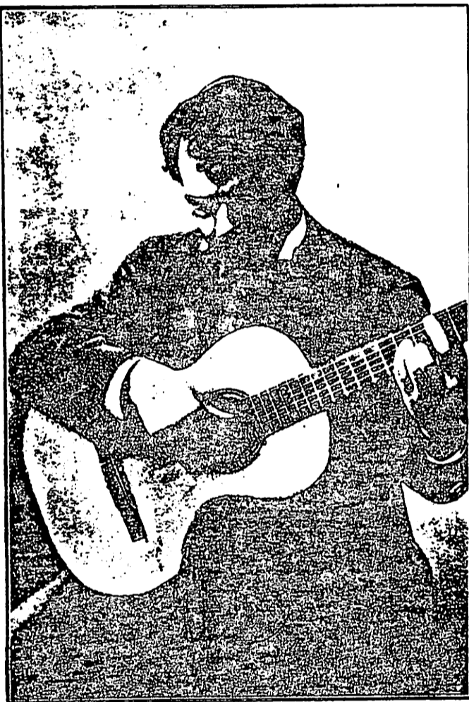
FRANCISCO TARREGA Celebre concertista di Chitarra

Adempiamo ad una promessa fatta lo scorso mese di gennaio, pubblicando un Minuetto per Chitarra sola del compianto e celebrato chitarrista spagnolo, Francisco Tárrega. È una delle tante piccole ma per geniali opere dove l'eminente artista profuse le apprezzate sue doti anche di compositore squisito. Molte sono infatti le pagine musicali che oggi sono oggetto di studio nei moderni ma rari chitarristi. Ne accenniamo qualcuna: Capriccio gavotta; scherzo in re magg.; Fantasia su motivi pagnuoli; Capriccio arabo e moltissime trascrizioni di opere e celebri. (vedi in 4 a pagina)