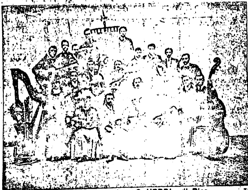
Circolo Mandolinistico « G. VERDI », di Pisa.